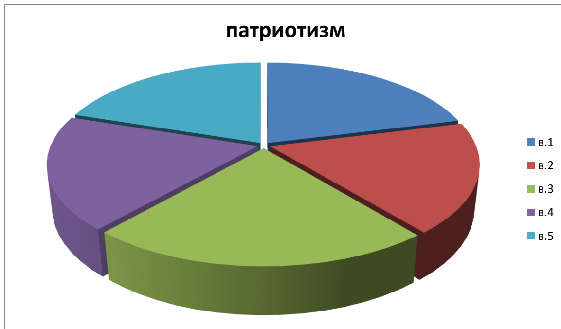
Рис.1. Патриотизм в современном обществе

Сделала круговую диаграмму «Патриотизм в современном обществе».